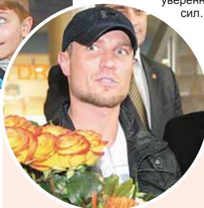
Персонально Оксану встречал её близкий друг, олимпийский чемпион Роман КОСТОМАРОВ