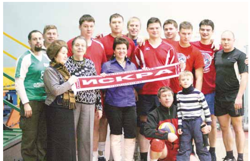
Одинцовские волейбольные болельщики уже не только в совершенстве изучили любимую игру в теории, но и успешно осваивают ее на площадке