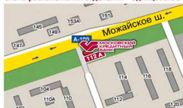
Схема расположения отделения «Одинцовское»