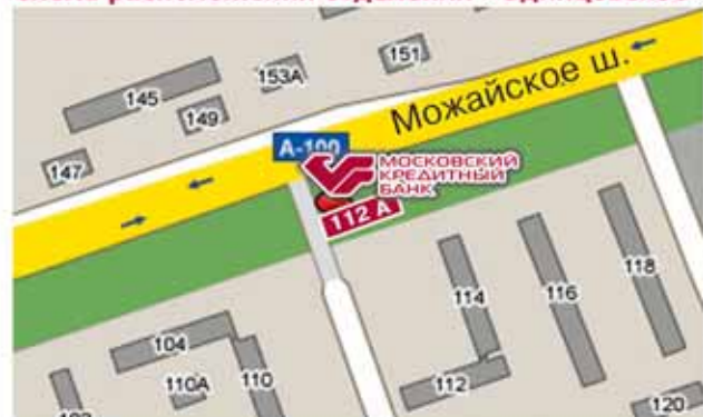
Схема расположения отделения «Одинцовское»

Адрес отделения МОСКОВСКОГО КРЕДИТНОГО БАНКА в г. Одинцово: Можайское ш., д. 112 А. Тел.: (498) 600-66-33, (498) 600-66-66. Справочная служба Банка: 8-800-100-4-888. Сайт www.mkb.ru.